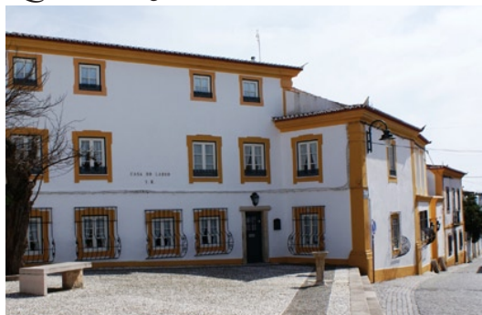
Casa do Largo