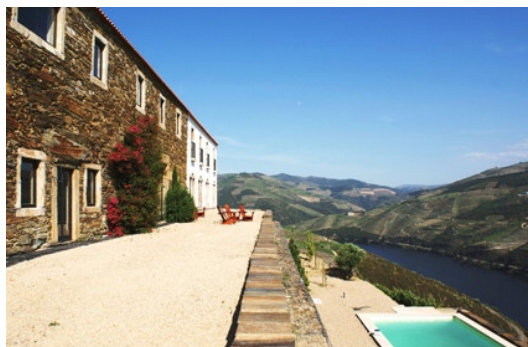
Quinta da Veiga

Situada mesmo no Centro Histórico da Vila do Crato, é uma antiga casa de família integralmente recuperada e adaptada para Turismo de Habitação. A Casa do Largo exhibe actualmente o seu antigo esplendor, recuperada e decorada com o conforto de uma habitação contemporânea, alia ao charme a alma de uma casa com tradição. Tem sete quartos distribuídos pela casa, cinco dos quais na casa mãe e dois com entrada independente e com preços a partir de 110€ por noite.